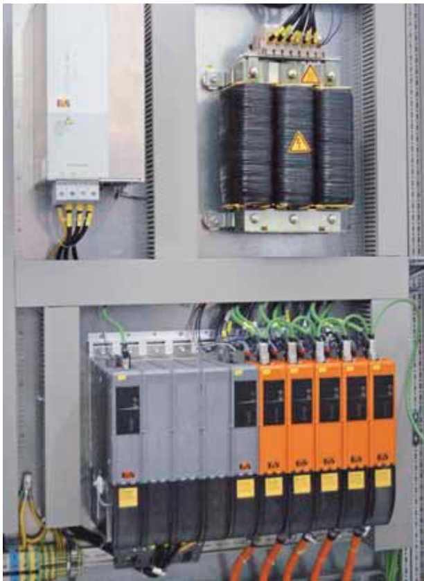
Übersichtliche, hoch integrierte Antriebstechnik: B&R ACOPOSmulti.

den Komponenten kümmern und haben nur einen Ansprechpartner.“