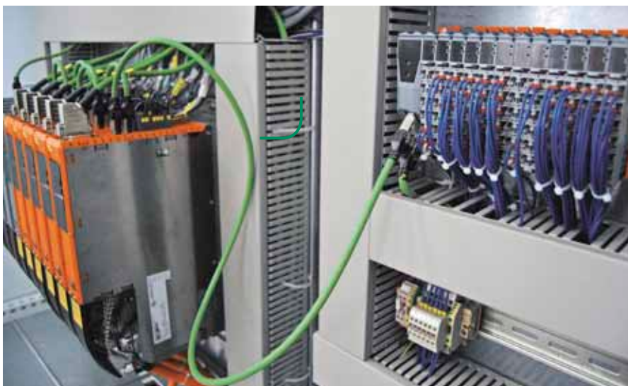
Geringer Platz- und Verkabelungsaufwand im Schaltschrank: Sämtliche interne Kommunikation zwischen der CPU, den intelligenten Antriebsmodulen ACOPOS-multi (links) und den platzsparenden I/O Modulen der X20 Serie (rechts) erfolgt über POWERLINK.

Dieser Aufbau hat gegenüber klassischen Ansätzen vier Vorteile: Zum Einen ist die Bautiefe der Maschine auf Grund der senkrechten Laufbahnen für die Schwingen in einem Portal sehr gering und verbraucht dadurch sehr wenig wertvolle Standfläche. Zum Anderen ist die Steifigkeit in z-Richtung konstruktiv bedingt enorm und liegt weit über dem Gewohnten. Zum Dritten kann auch die Steifigkeit in x- und y-Richtung durch >>>