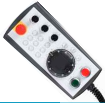
Zukunftsweisende Ergonomie: Bereits vor dessen kommerzieller Verfügbarkeit integrierte das TU Institut das B&R CNC Panel samt Handbediengerät.

Die Antwort auf die Frage nach neuen Wegen im Werkzeugmaschinenbau heißt X-Cut und ist eine Maschine, deren Hauptspindel sich innerhalb des zur Verfügung stehenden Raumes in zwei Achsen völlig frei bewegen und positionieren lässt. Eine dritte und eventuell vierte Achse können durch Längsbewegung des Werkzeugträgers auf der Spindel bzw. durch Verfahren des Werkstückträgers hinzukommen.