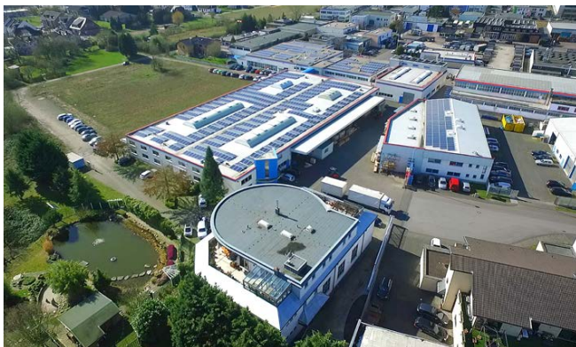
Der Unternehmenssitz der Maschinenbau Kitz GmbH in Troisdorf

Gemeinsam mit der Umwandlung einer großen Menge an Bestandsdaten und der Möglichkeit des Zugriffs auf von den Herstellern gepflegter Originaldaten über Eplan Data Portal verbessert sich die Datenqualität erheblich. Die Ausgabe einer gemeinsamen, eindeutigen mechatronischen Stückliste sorgt für Klarheit und unterstützt effiziente Prozesse in Arbeitsvorbereitung, Einkauf und Ersatzteillogistik.