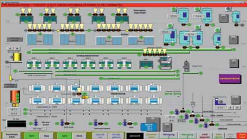
Einfach zu überwachen und zu bedienen: die vollständige Repräsentation der Hartweizenmühle im Werk Raaba in zenon.