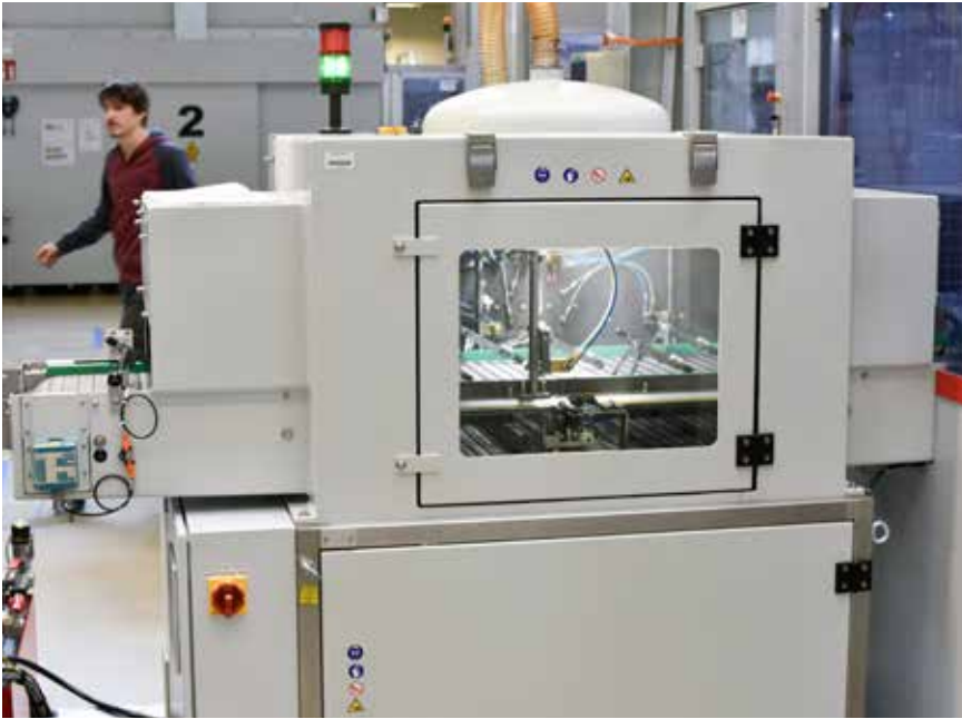
Die anschließende Konservierung der Teile in einem ebenfalls von MAP Pamminger gelieferten Durchlaufkonservierer von SLE Technology.