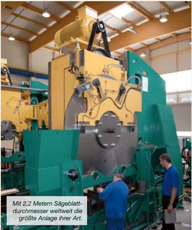
Mit 2,2 Metern Sägeblatt-durchmesser weltweit die größte Anlage ihrer Art.

In Liezen wird bereits seit der Unternehmensgründung 1994 mit Unigraphics-Software konstruiert. Den damaligen 2D-Konstruktionssystemen längst entwachsen, hat der Großmaschinenbauer durch ständiges Updating und Upgrading die Softwareausstattung stets auf dem aktuellen Stand gehalten, und das nicht nur im Stammwerk, sondern auch an anderen Standorten und bei Tochterunternehmen. Im Herbst 2007 erfolgt der unternehmensweite Umstieg von NX3 auf NX5.