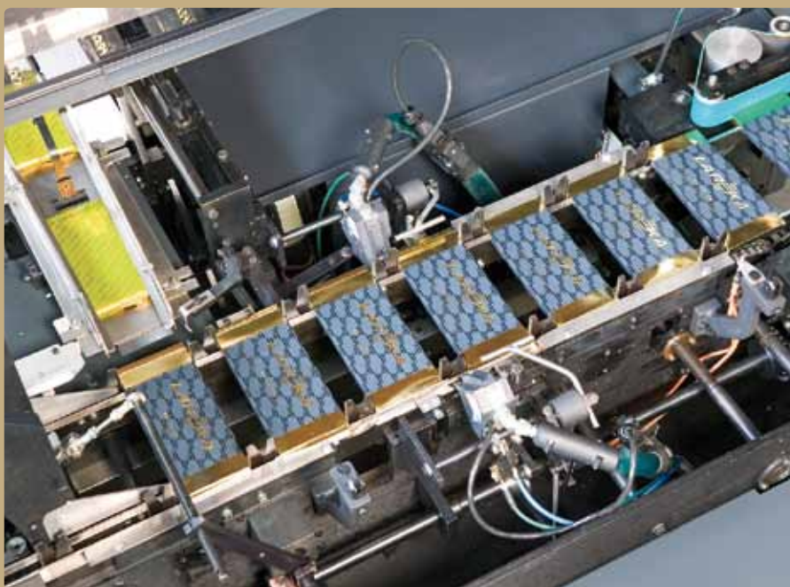
In einem zweistufigen Prozess werden in der größeren Schwestermaschine TP 75 ds pro Minute 75 Schokoladentafeln zunächst in Kunststoffolie eingeschweißt und kommen anschließend in hochwertige Einzelverpackung aus Karton.

Mit dem modularen Antriebssystem der Serie DIAS-Drive 100 werden die Servomotoren angesteuert. Bis zu vier Achsmodule für einen oder zwei Servo-Antriebe können pro Baugruppe kombiniert werden. Zum Visualisieren und Bedienen ist bei PortionPack das TAE 151 im Einsatz – ein 15 Zoll Panel mit Farb-Touchscreen. Die Kommunikation erfolgt über das hart echtzeitfähige Industrial Ethernetsystem VARAN, das die Daten zwischen den unterschiedlichen Systemeinheiten transportiert. Dazu gehören auch die Signale des Not-Halt-Tasters und der Sicherheitsabdeckung. Sie werden in einem C-DIAS Safety Modul ausgewertet, das sich einfach in die Reihe der Steuerungsmodule integrieren ließ. Da der VARAN-Bus nach dem Black Channel Prinzip auch Safety-Daten transportiert, wurde die zuvor erforder-