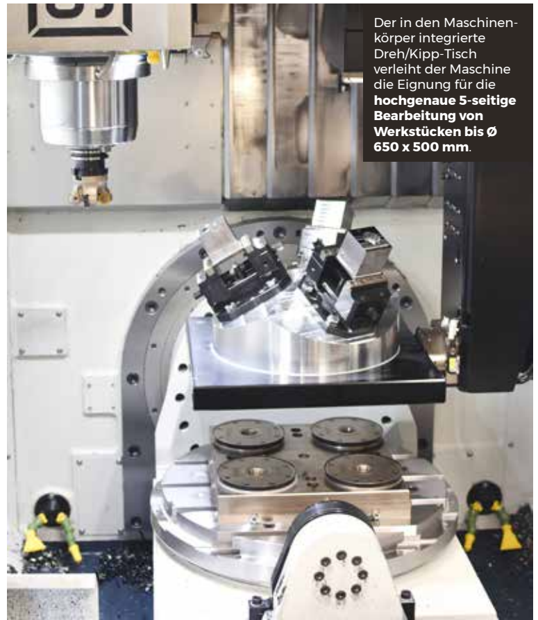
Der in den Maschinenkörper integrierte Dreh/Kipp-Tisch verleiht der Maschine die Eignung für die hochgenaue 5-seitige Bearbeitung von Werkstücken bis Ø 650 x 500 mm.

Eine Werksbesichtigung bei Spinner in Sauerlach bei München stellte jedoch die Investitionsplanung völlig auf den Kopf. „Ein langjähriger, erfahrener Mitarbeiter stand zu dieser Zeit kurz davor, in Pension zu gehen“, berichtet Markus Reisner. „Ihn zu ersetzen, war angesichts des herrschenden Konkurrenzkampfes um Fachkräfte in diesem Bereich für sich schon eine Herausforderung.“ Auch bei Maschinenbau Reisner kennt man die unbefriedigende Situation, dass hoch quali- >>