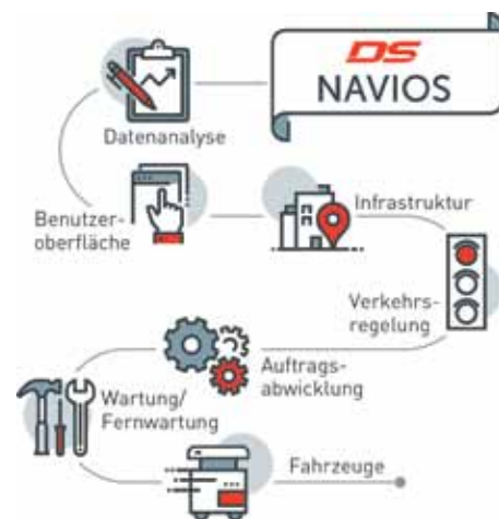
Die FTS-Leitsteuerung „DS Navios“ ist das zentrale Element jeder FTS-Anlage.

Bei spurgeführten Systemen folgen die Fahrzeuge Magnetbändern oder Induktionsschleifen, die in den Boden eingelassen oder – zum Herstellen temporärer Verbindungen – auf diesen aufgeklebt sind. Neben der Navigation können diese auch dem permanenten Nachladen der Batterien in den Fahrzeugen dienen, um Ladezeiten zu vermeiden. Ihre Hauptanwendung liegt in der Fließproduktion, wo sie als Werkstück- oder Plattformträger fest installierte Rollen- oder Hängeförderer ersetzen. So flexibilisieren sie vor allem Montageprozesse. Frei navigierende Fahrerlose Transportfahrzeuge werden meist in klassischen Intralogistik-