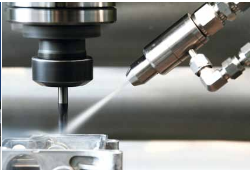
Mit dem CO 2 -Schneestrahlsystem aus dem quattroClean-System der acp - advanced clean production GmbH wird Kühlen und Reinigen zu einem gemeinsamen Prozess.

Zur Reinigung zwischen verschiedenen Bearbeitungsschritten werden Bauteile meist aus automatisierten Fertigungslinien aus- und danach wieder eingeschleust. Mit dem CO 2 -Schneestrahlsystem quattroClean der acp - advanced clean production GmbH lässt sich dieser zeit- und kostenintensive, unproduktive Schritt eliminieren. Das direkt in die Fertigungsmaschine integrierbare, modulare und hochflexible System ermöglicht die Vorreinigung des Werkstücks während des Bearbeitungsvorganges. Es verringert die Gratbildung, bringt höhere Vorschubgeschwindigkeiten und sorgt für perfekt zur Weiterverarbeitung geeignete Teile direkt aus dem CNC-Bearbeitungszentrum.