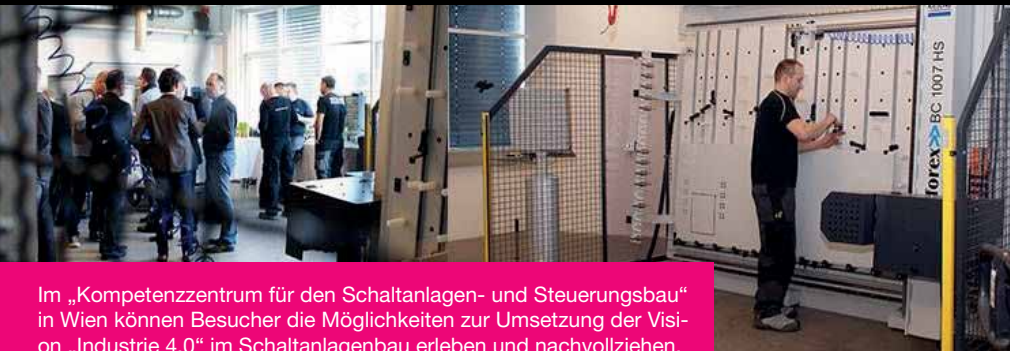
Im „Kompetenzzentrum für den Schaltanlagen- und Steuerungsbau“ in Wien können Besucher die Möglichkeiten zur Umsetzung der Vision „Industrie 4.0“ im Schaltanlagenbau erleben und nachvollziehen.

Damit ergänzen Rittal und seine Partnerunternehmen das Produktportfolio, mit denen sie ihren Kunden ermöglichen, die Vision von Industrie 4.0 im eigenen Betrieb schrittweise wahr werden zu lassen, zumindest im Schaltanlagenbau. Und weil sich das leichter sagt als glaubt, hat Rittal im Februar 2015 in Wien ein „Kompetenzzentrum für den Schaltanlagen- und Steuerungsbau“ eröffnet, in dem Besucher diese Möglichkeiten erleben und nachvollziehen können.