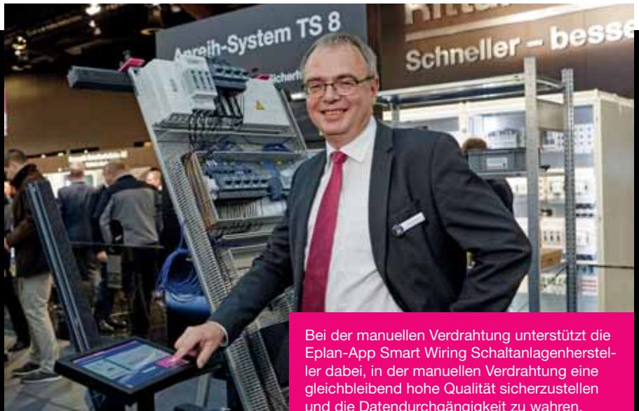
Bei der manuellen Verdrahtung unterstützt die Eplan-App Smart Wiring Schaltanlagenhersteller dabei, in der manuellen Verdrahtung eine gleichbleibend hohe Qualität sicherzustellen und die Datendurchgängigkeit zu wahren.

Obwohl im Schaltanlagenbau die Einzelanfertigung die Regel ist, lässt sich in der Planung vieles standardisieren und ein modularer Baukasten gestalten, aus dem sich