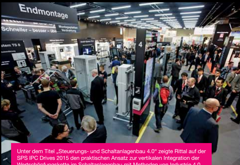
Unter dem Titel „Steuerungs- und Schaltanlagenbau 4.0“ zeigte Rittal auf der SPS IPC Drives 2015 den praktischen Ansatz zur vertikalen Integration der Wertschöpfungskette im Schaltanlagenbau mit Methoden von Industrie 4.0.

„Diese digitale Produktbeschreibung ist die Grundlage, auf der eine weitgehend automatisierte Produktion erfolgen kann, denn sie trägt alle Informationen in sich, die für die Blechbearbeitung und für die Bestückung benötigt werden, ebenso für die Kabelkonfektionierung und -verlegung →