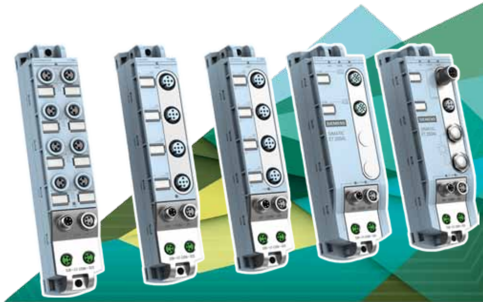
Mit kleinen Abmessungen, geringem Gewicht, hoher Vibrations- und Schockbeständigkeit und einem erweiterten Temperaturbereich eignet sich die kompakte und leichte Geräteserie Simatic ET 200AL für dezentrale Anwendungen des modularen Maschinenbaus, besonders in der Handhabungstechnik.

Eines dieser Konzepte ist die schaltschrankfreie Montage der Ein- und Ausgangsbaugruppen direkt am Maschinenrahmen. Sie ist die logische Fortsetzung des Feldbusgedankens, den Siemens mit Profibus und der Profinet seit vielen Jahren konsequent verfolgt. Erst durch die Möglichkeit von Sensoren erfasste und an Aktoren gerichtete Signale zu bündeln, ergab sich die Möglichkeit zur Modularisierung