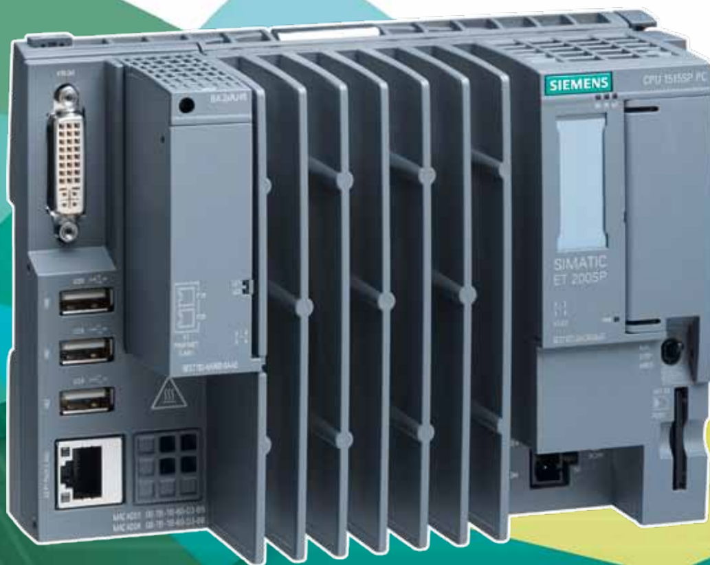
Der SIMATIC ET 200SP Open Controller verbindet als erster Controller dieses Typs die Funktionen eines PC-basierten Software Controllers mit Visualisierung, PC-Anwendungen und zentralen I/Os (Input/Output) in einem kompakten Gerät.

Sicherheitsprogrammen. Sie sind nach EN 61508 (2nd Edition) für Funktionale Sicherheit zertifiziert und eignen sich für den Einsatz in sicherheitsgerichteten Applikationen bis SIL 3 nach IEC 62061 und PL e nach ISO 13849. Sie verfügen zusätzlich über einen zusätzlichen Passwortschutz für F-Konfiguration und F-Programm für die IT-Security. Die in zwei Leistungsstufen verfügbare CPU kann als PROFINET IO Controller oder als dezentrale Intelligenz (PROFINET I-Device) zum Einsatz kommen.