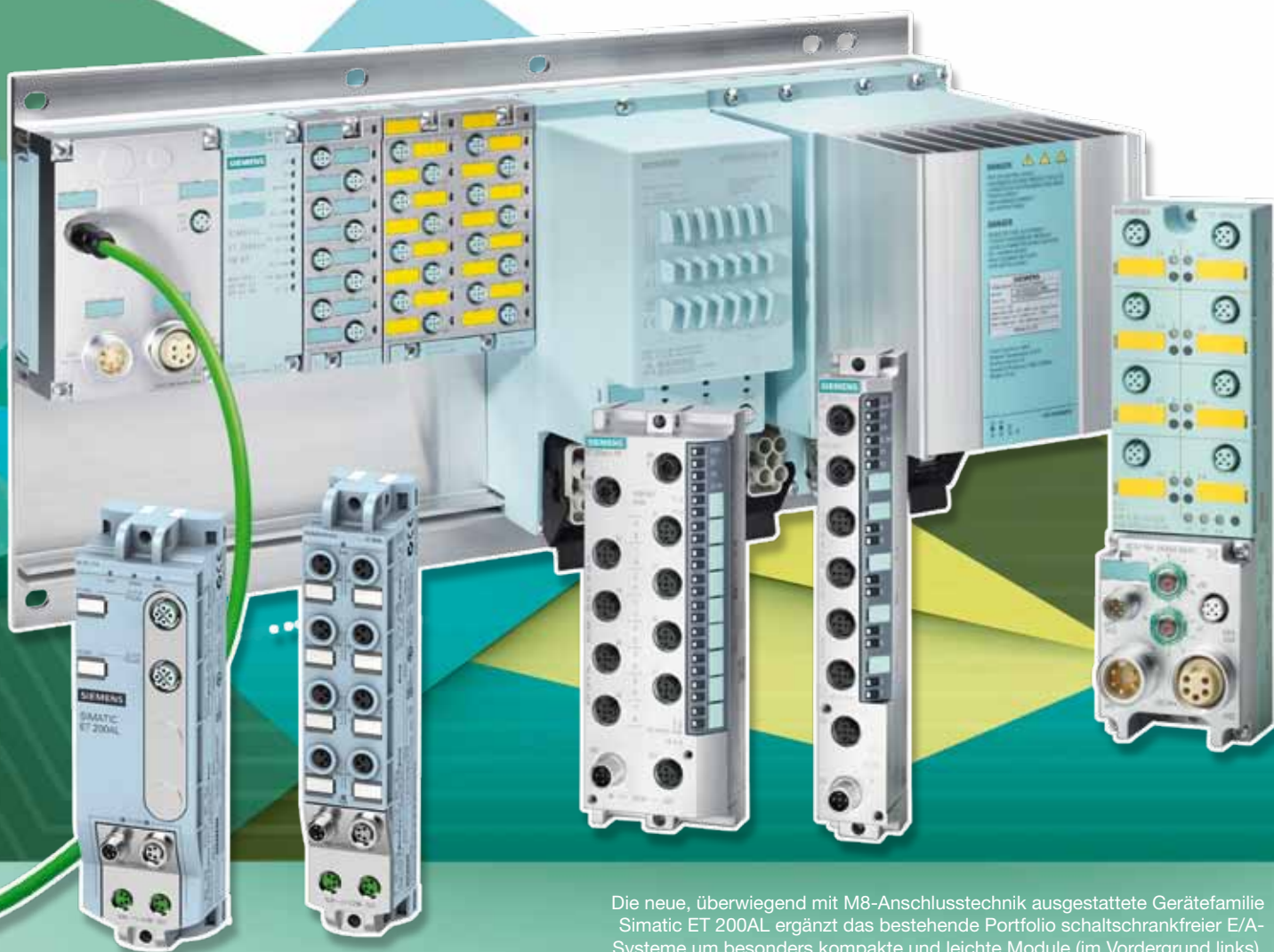
Die neue, überwiegend mit M8-Anschluss-technik ausgestattete Gerätefamilie Simatic ET 200AL ergänzt das bestehende Portfolio schaltschrankfreier E/A-Systeme um besonders kompakte und leichte Module (im Vordergrund links).