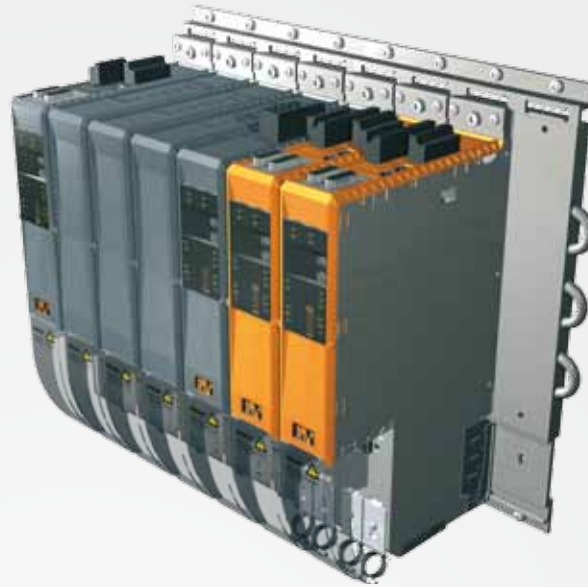
Mit der Cold-Plate-Schalterschrankmontage kann die Abwärme aus den Drives direkt abgeführt und als Prozesswärme weitergenutzt werden. Das erspart Investition und Energieaufwand für das kostenintensive Schalterschrank-Thermalmanagement.

Bernecker + Rainer Industrie-Elektronik Ges.m.b.H. B&R Straße 1, A-5142 Eggelsberg Tel. +43 7748-6586-4119 www.br-automation.com