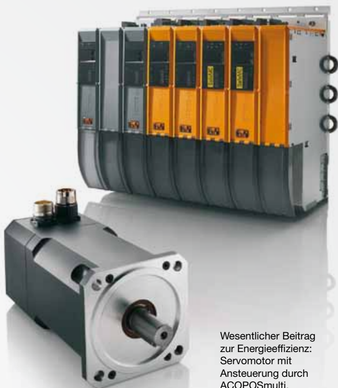
Wesentlicher Beitrag zur Energieeffizienz: Servomotor mit Ansteuerung durch ACOPOSmulti.