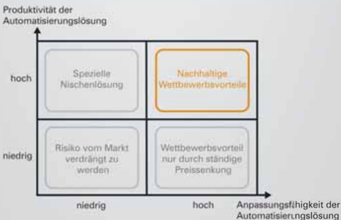
Spannungsfeld der Wettbewerbsfähigkeit.

Die Berücksichtigung der Folgekosten wird seit Jahren von uns in Gesprächen mit Kunden direkt angesprochen und diskutiert. Wir sehen eine zunehmende Sensibilisierung auf dieses Thema, da die Endkunden immer mehr auf eine gesamtheitliche Kostenbetrachtung Wert legen. Durch die Internationalisierung sind die Endkunden oft weltweit verteilt und damit unter Umständen sehr weit vom Maschinenbauer entfernt. Durchgängige Fernwartung auf alle B&R Komponenten reduziert den Wartungsaufwand und damit die Kosten erheblich.