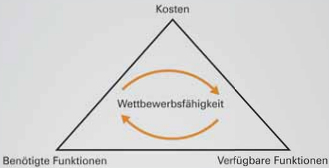
Spannungsfeld der Wettbewerbsfähigkeit.