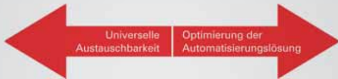
Spannungsfeld der Wettbewerbsfähigkeit.