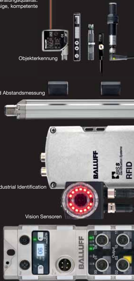
Industrial Networking und Connectivity