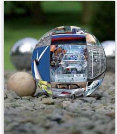
Durch den datenbankbasierten Plattformaufbau unterstützt das EPLAN Engineering Center die nonverbale Kommunikation zwischen Entwicklern der einzelnen Disziplinen.