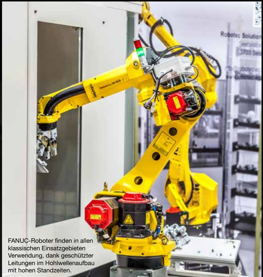
FANUC-Roboter finden in allen klassischen Einsatzgebieten Verwendung, dank geschützter Leitungen im Hohlwellenaufbau mit hohen Standzeiten.

Österreichische Maschinen- und Anlagenbauer leben zu einem erheblichen Teil davon, dass sie es schaffen, sehr stark individualisierte Lösungen mit hoher Funktionsdichte, Qualität und Zuverlässigkeit zu